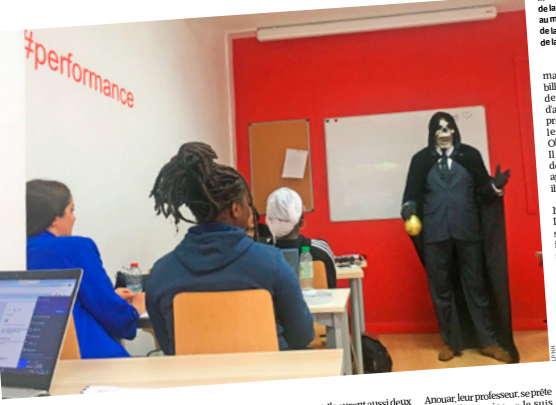
Montreuil, le 20 mai. Les élèves de la prépa Haka Game font face au maître du jeu, qui vient de lancer le premier défi de la formation.

HELENE HAUS UNE MUSIQUE inquiétante envahit la pièce. Le maître du jeu fait alors son entrée dans la salle de classe. Vient d'une capitale, d'une tête de mer couvrant son visage, il tient un sac de billes. « Le slams, vous connaissez ? Deux minutes ! » hurle-t-il d'une voix autoritaire qui fait sourire la majorité des élèves. « Le jeu, vous savez ? Trois minutes ! » hurle-t-il d'une voix autoritaire qui fait sourire la majorité des élèves. « Le jeu, vous savez ? Trois minutes ! » hurle-t-il d'une voix autoritaire qui fait sourire la majorité des élèves.