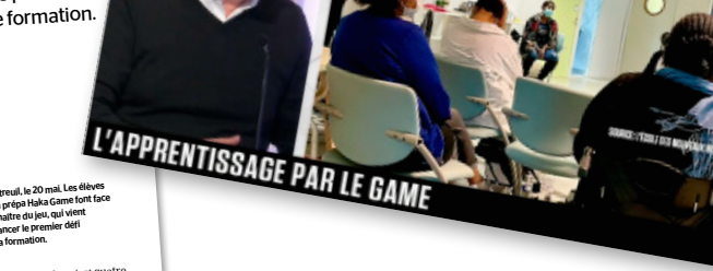
L'APPRENTISSAGE PAR LE GAME

Renseignements sur http://www.lesnouveauxmondes.fr/